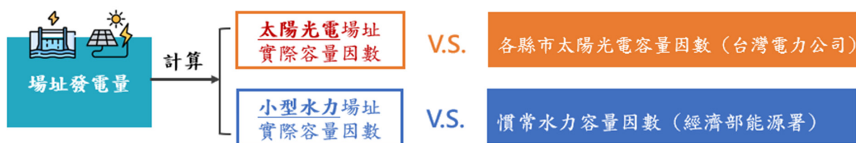
表 3 112 年各縣市容量因數與研究場址實際容量因數比較

計算出各場址的實際容量因數後，太陽光電場址與台電公告的「各縣市太陽光電容量因數」比較，小型水力場址則與「慣常水力容量因數」對照。